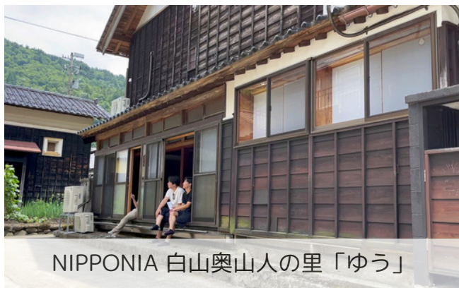
NIPPONIA 白山奥山人の里「ゆう」