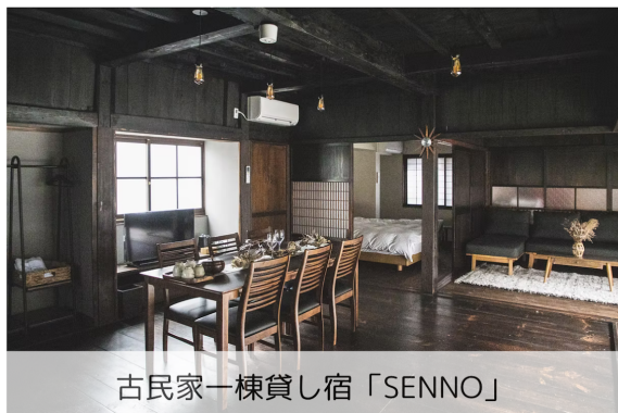
古民家一棟貸し宿「SENNO」