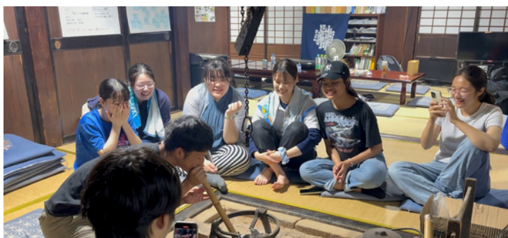
奥山人の昔の暮らし体験