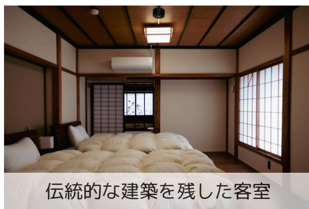
伝統的な建築を残した客室