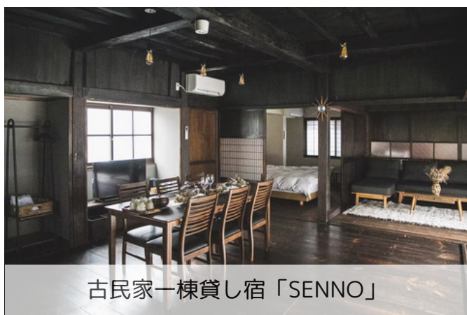
古民家一棟貸し宿「SENNO」