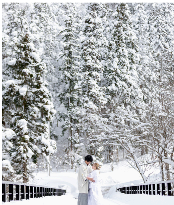
雪のウェディングフォト