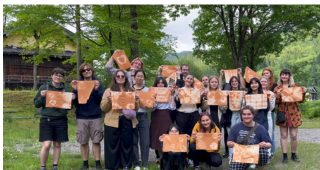
同じものが一つもない染め物体験