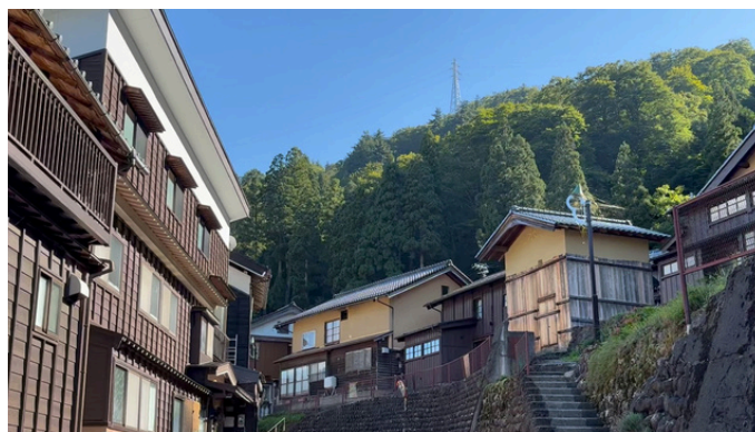
白峰重要伝統的建造物群保存地区