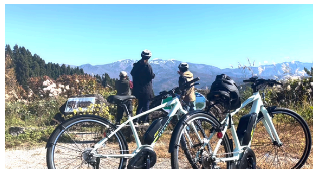
E-Bikeで自然を感じるサイクリング