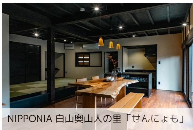
NIPPONIA 白山奥山人の里「せんによも」