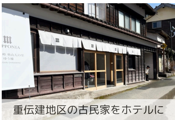
重伝建地区の古民家をホテルに

★地域の宿泊、食、体験、事業支援等を担う組織で構成され、白峰の地域資源を活かした農泊（当地域では「林泊」）プログラムを開発・提供しています。令和4年度には、観光振興による地域づくりを实践すべく事業家、学識者が集まり、分野横断的な「地域まるごと活性化」を目的とした法人「株式会社YOSITAI」が設立され、現在、当協議会の中核組織を担っています。