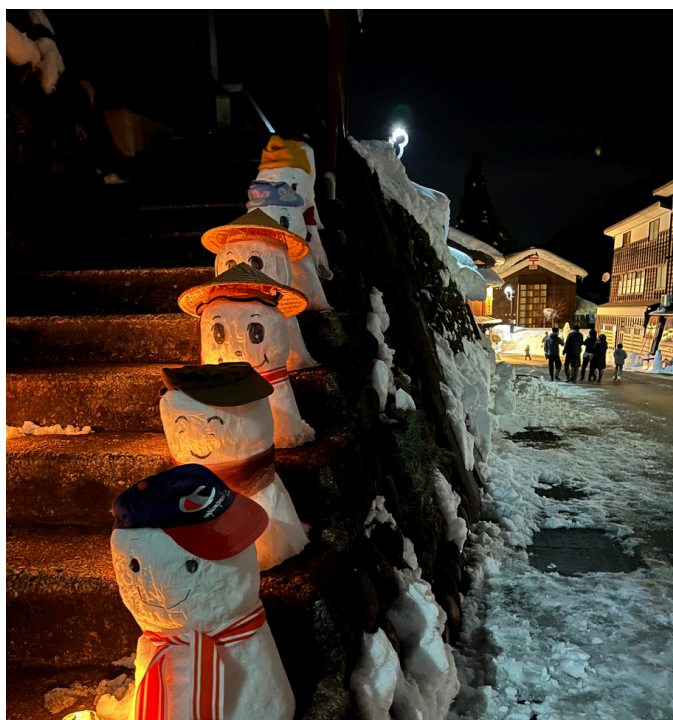
まちが雪だるまだらけ！雪だるままつり