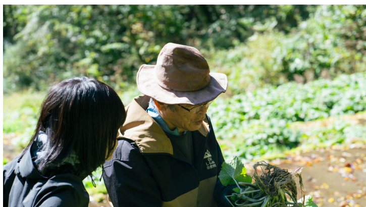
源流のわさび田で収穫体験