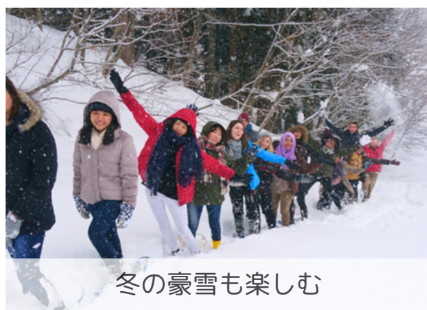
冬の豪雪も楽しむ