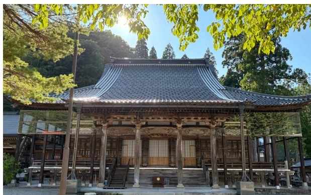
白山下山仏が安置される林西寺