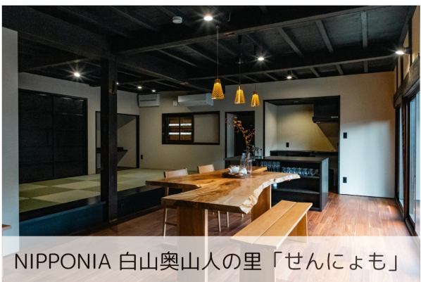
NIPPONIA 白山奥山人の里「せんによも」