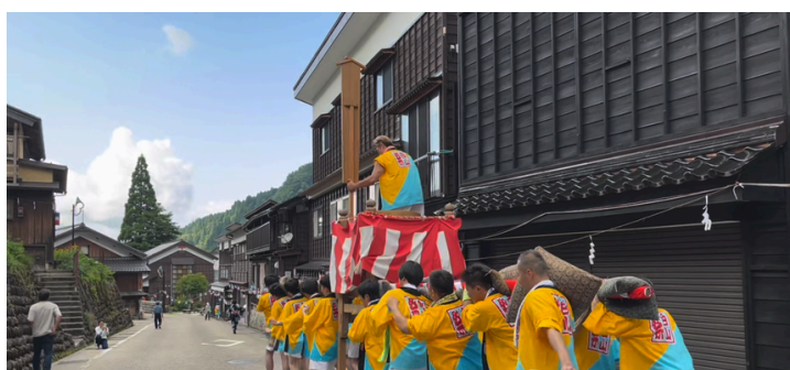
白山に感謝する白山まつりに参加