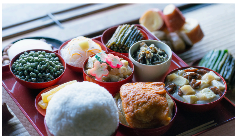
お寺の大切な行事「報恩講」のごちそう