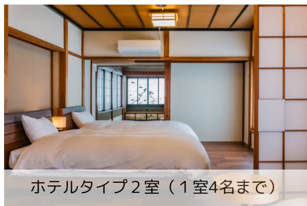
ホテルタイプ2室（1室4名まで）