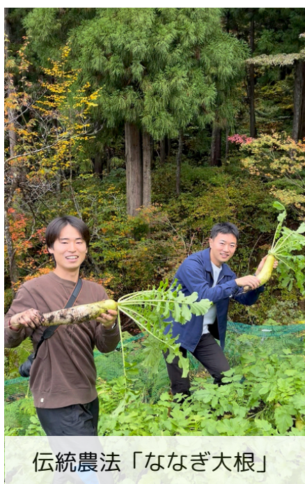
伝統農法「ななぎ大根」