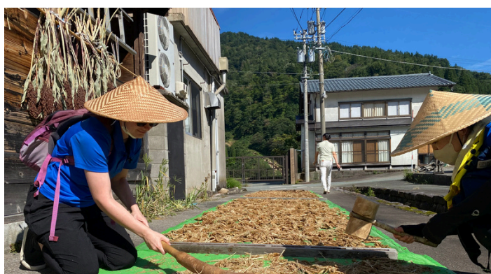
伝統農作物の農業体験