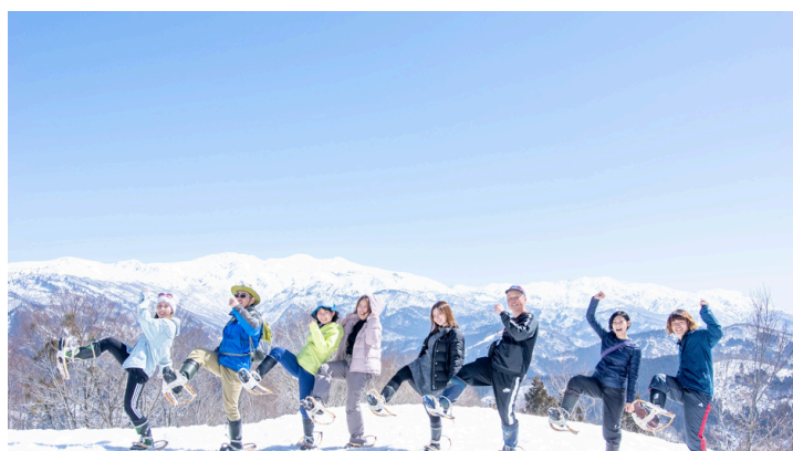
雪の中で遊ぶ「かんじきハイク」