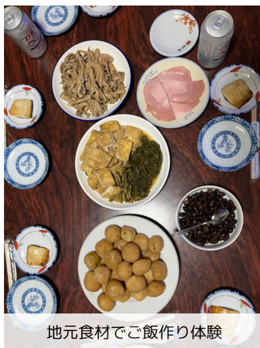
地元食材でご飯作り体験