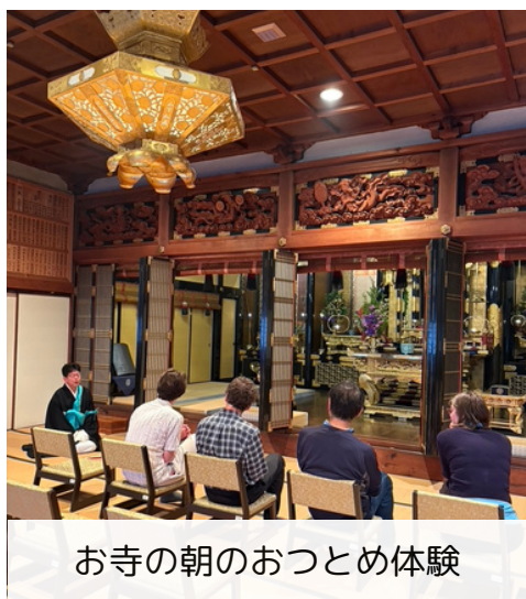
お寺の朝のおつとめ体験