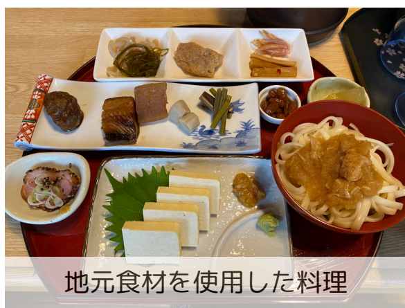
地元食材を使用した料理