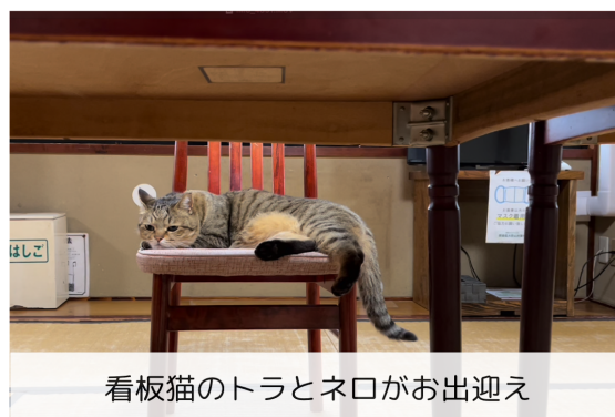
看板猫のトラとネロがお出迎え