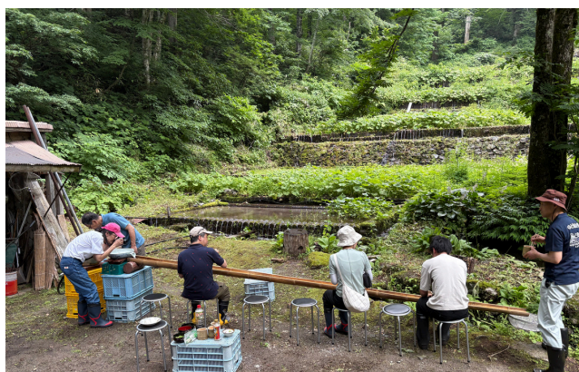
収穫したわさびで流しそうめんランチ